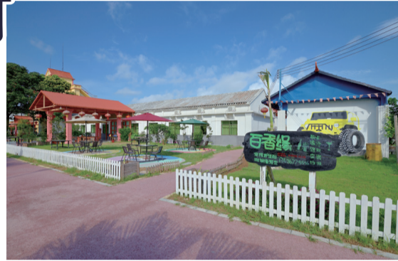
歸僑們完好保持着海外居住國語言、文化藝術和生活習俗，花田驛站、花樹小道、繽紛牆繪、七色巷子相互點綴。