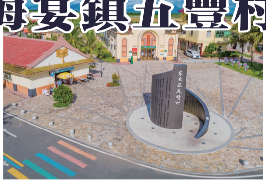
村口浪花形狀的“東南亞風情村”地標建築寓意歸僑們漂洋過海後終於能在此安定。