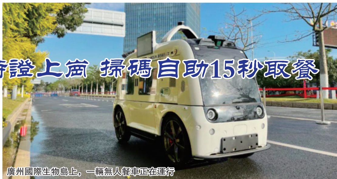
廣州國際生物島上，一輛無人餐車正在運行